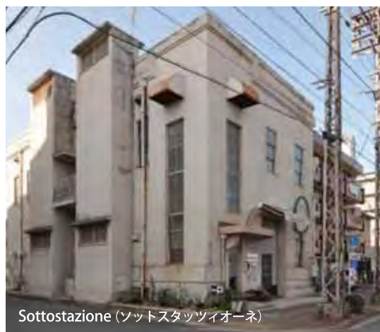
Sottostazione（ソットスタツツイオーネ）