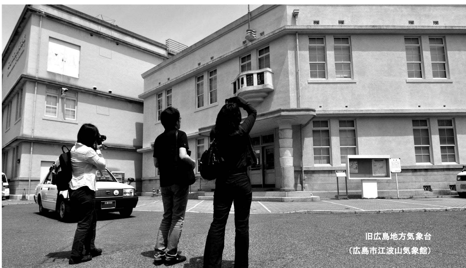
旧広島地方気象台 (広島市江波山気象館)